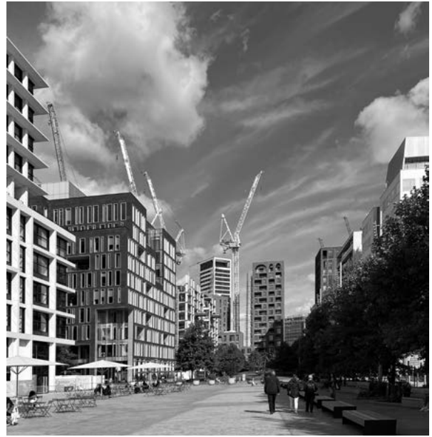
Nová kodaňská čtvrť Nordhavn (vlevo) a nová londýnská čtvrť King's Cross (vpravo).