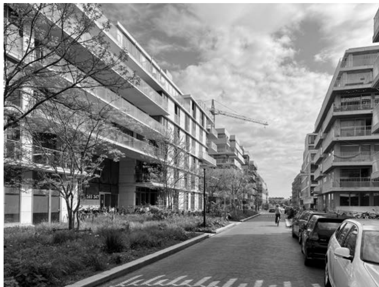
Nové amsterodamské čtvrti: Zuidas (vlevo) a Overhoeks (vpravo).